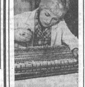
Польша. Завод точной механики «Мера» в Влоде — один из лидеров протектората в жизни Коммунистической программы социалистической экономической интеграции стран — членов СЭВ.

ПРАГА. Чехословацкие строители начали сооружение четвертой атомной электростанции. Она воздвигается в местечке Дукованы на юге республики.