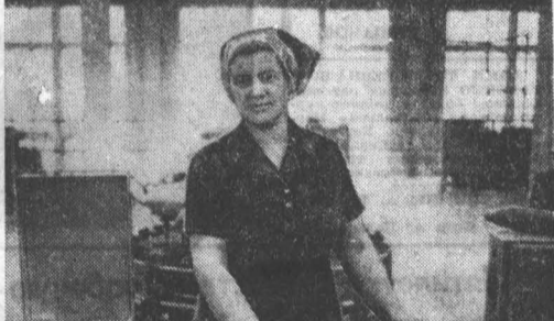
Значительную реконструкцию производства в юбилейном году провел коллектив Бийского льнокомбината.

БОЛЬШИНСТВО ПОДРЯДНЫХ ОРГАНИЗАЦИЙ края добилось в первый месяц четвертого квартала известных сдвигов. Продолжалась концентрация сил и ресурсов на цеховых объектах. Ускоряют работ спланировано массовое соревнование за достойную встречу шестидесятилетнего юбилея Великой Октябрьской социалистической революции. Об успешном выполнении заданий и обязательствах рапортовали многие бригады строителей и монтажников, а также более крупные подразделения и подразделения организаций, проектирования. Тресты и СУ Главалтайстрой в октябре работали на ряде пусковых строек более высокими темпами, чем в предшествующие месяцы. Так, на плавильном заводе сосредоточено примерно пятая часть строителей и монтажников. Усилены работы на производственных площадях и мощностях заводов Барнаульского котельного, «Трансмаша». Однако до сих пор сохраняются с государственным планом освоения капитальных вложений лишь два крупных подразделения Главалтайстрой — Бийский трест № 122 и Барнаульский домостроительный комбинат. Большим problem в работе Главалтайстрой является то, что он не сумел ввести в эксплуатацию в октябре Кузнецкий завод синтетического кирпича и цех деревообрабатывающих плит Барнаульского деревообрабатывающего завода.