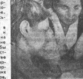
основном остались женщины и подростки, была поставлена задача — обеспечить армию и страну продовольствием и сырьем. Благодаря умелому руководству Алтайской партийной организации трудящиеся сельского хозяйства с заданиями партии и правительства успешно справились. Только в 1941 году колхозы и совхозы края сдали государству на 12 миллионов пудов хлеба больше, чем в последний предвоенный год.

Трудно дать оценку трудовому и политическому подвигу рабочих, колхозного крестьянства и интеллигенции в суровые годы войны. Перед труженниками деревни, где в основном остались женщины