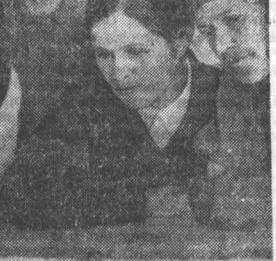
ста сорока шафоновых пар. Немало приняли молодых инженеров, экономистов, юристов на заводах, в стройтрестах, на предприятиях тракторостроя. К примеру, АТЗ только в этом году приняло около тридцати дипломированных инженеров. Все они имеют работу по специальности.

Дю войны на Алтае почти не было тяжелой промышленности и машиностроения. В военные годы по решению ЦК ВКП(б) и Советского правительства в край было перебазировано из европейских частей свыше ста промышленных предприятий, преимущественно машиностроительных. Первым прибыл