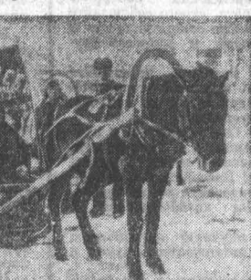
Свыше 4-х тысяч женщин края было выдвинуто на руководящую работу, 303 работали председателями колхозов. Осенью 1941 года на комбайнах и тракторах работали 18.000 алтайских женщин, а до войны всего 2.000. Инициатива, почин, ударный труд, разрывание оковы патристического соревнования, движение тысячников и духотысчников — трудно перечислить все добрые дела, шедшие от самого сердца бойцов тыла.

За годы войны наш край дал стране около 160 миллионов пудов хлеба, свыше 9 млн. пудов мяса, более 3 млн. пудов сахара.