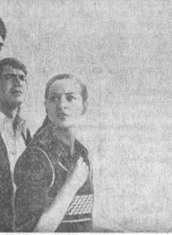
Мошков Владимир Николаевич, начальник управления Комитета государственной безопасности при Совете Министров СССР по Алтайскому краю, генерал-майор.

Главным управлением спортивных лотерей подведены итоги 40 тиража «Спортлото» и «Спортлото-2», состоявшегося 5 октября. «СПОРТЛОТО»: шесть и пять плюс один номера не угадал никто; для угадывания пяти номеров сумма выигрыша — по 4.530 руб. (12 карточек); четыре номера — по 50 руб. (1.780 карточек); три номера — по 4 руб. (24.312 карточек).