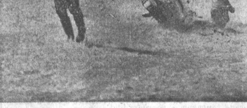
«ТРУДНЫЕ ГОНКИ».

Синяя птица обладает сильным приятным голосом.