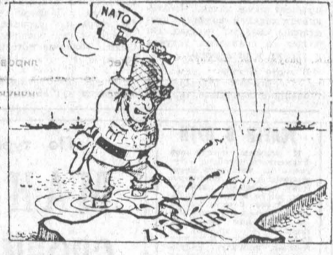
НАТО ЗА РАБОТОМ. «Фольксштайме», Вена.