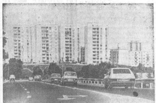
Рузичи — крупный промышленный центр Румынии. Здесь ведется большое жилищное строительство.