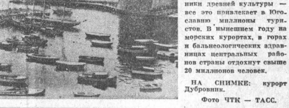
В объективе — Югославия. Красота Адриатического моря, золотые пляжи, уникальные памятники древней культуры — все это привлекает в Югославию миллионы туристов.

СОФИЯ. В Болгарии отмечен день шахтера. Высокими трудовыми достижениями встретили свой профессиональный праздник горняки топливно-энергетического комбината «Балканбасс».