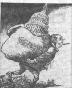
Конгресс — в мешке монополий.

Темы рисунков известного прогрессивного художника Оли Харриштона, которые регулярно помещают на своих страницах газеты американских коммунистов «Дейли уорлд» и «Шипла уорлд», подкапывают американскую империю на раскалывание о неправды в Соединенных Штатах элементарных прав и свобод, разоблачают фальшь американской демократии.