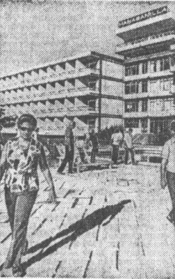
Право на отдых, как и право на труд, гарантируется каждому гражданину Кубы. В разгар летних отпусков и услугам трудящихся — восточные курорты страны, а также на острове Пинос, туристские центры. Ежегодно на создание новых курортных мест, строительство гостиниц и кемпингов, кафе и ресторанов, ассигнуется большие суммы. Сотни тысяч туристов имеют возможность провести свой отпуск в домах отдыха по легким и удобным путевкам. Только за последнее пятилетие из выданных около миллиона рабочих и служащих.

НА СНИМКЕ: гостиница «Альбаганаль» в горах Эскамбрия (провинция Валь-Клар).