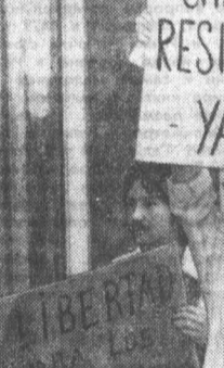
«Мы поддерживаем чилийскую борьбу за свободу слова».

Нью-Йорк. Демонстрация в поддержку борьбы чилийского народа против режима фашистской хунты.