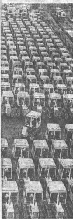
НА СНИМКЕ: Капшиковский тракторный завод. На отгрузочной площадке завода свисают с анклавы МТЗ готовые тракторы Т-70С. Многие из них уже выехали в колхозы и совхозы республики.

Цифры и факты: Упорный труд создавал сегодня новую республику. Вот некоторые факты из ее биографии. Они рассказывают о том, как преобразилась Молдавия под знаменем Октября при бескорыстной помощи всех народов нашей великой Родины.