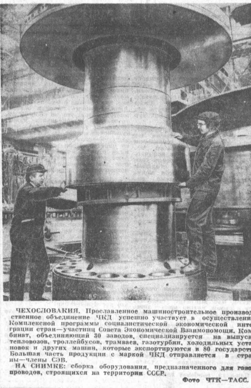
Чехословакия. Проведение машинностроительного производственного совещания. ЧКД успешно участвует в осуществлении Комплексной программы социалистической экономической интеграции стран — участниц Совета Экономической Взаимопомощи. Комбинат, объединяющий 30 заводов, специализируется на выпуске турбин, компрессоров, трамбасов, газотурбин, холодильных установок и других машин, которые экспортируются в 80 государств. Большая часть продукции с маркой ЧКД отправляется в страны — члены СЭВ. НА СНИМКЕ: сборка оборудования, предназначенного для газопроводов, строящихся на территории СССР.

Тщетные попытки. Вашингтон, ТАСС. В Белом доме состоялось двустороннее совещание по энергетическим проблемам, в котором участвовали представители администрации и губернаторы 44 штатов.