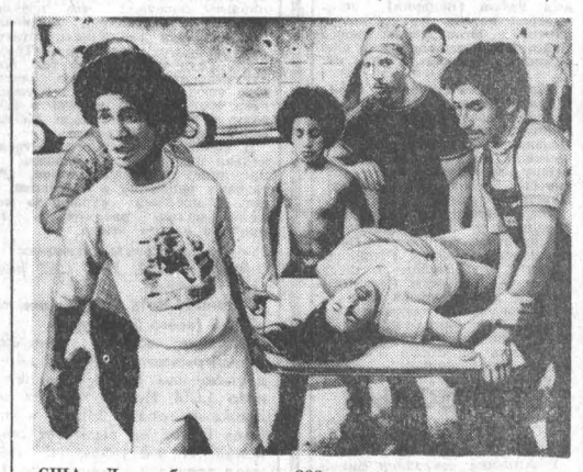
США. Двое убитых, около 200 раненых и свыше ста арестованных — таков итог полицейской расправы над студентами из чикагских трущоб. Тысячи участников демонстрации вышли на улицы города, чтобы заявить свой протест против дискриминации и потребовать независимости для острова, превращенного в колонию США. На снимке: студентки выносят пострадавшего товарища.

С. БУРАКОВ, помощник мастера Барнаульского меланжевого комбината.