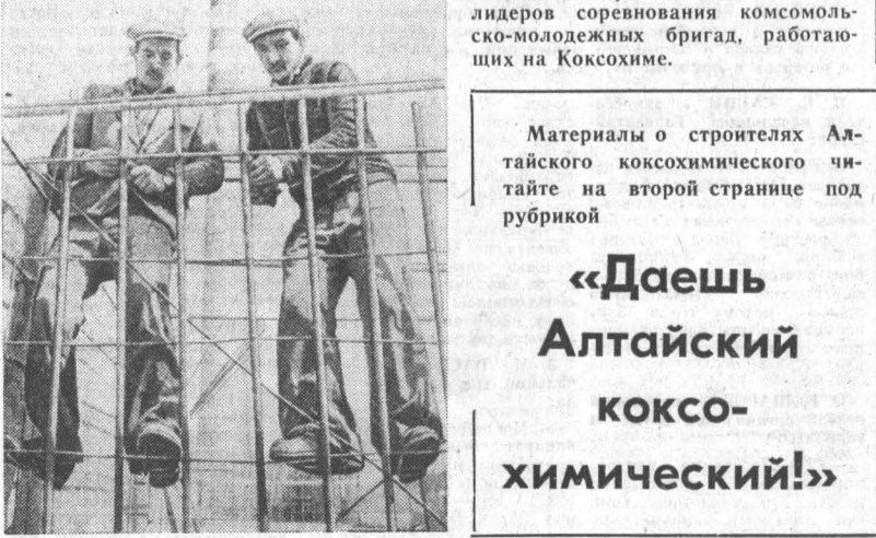
Материалы о строителях Алтайского коксохимического читайте на второй странице под рубрикой