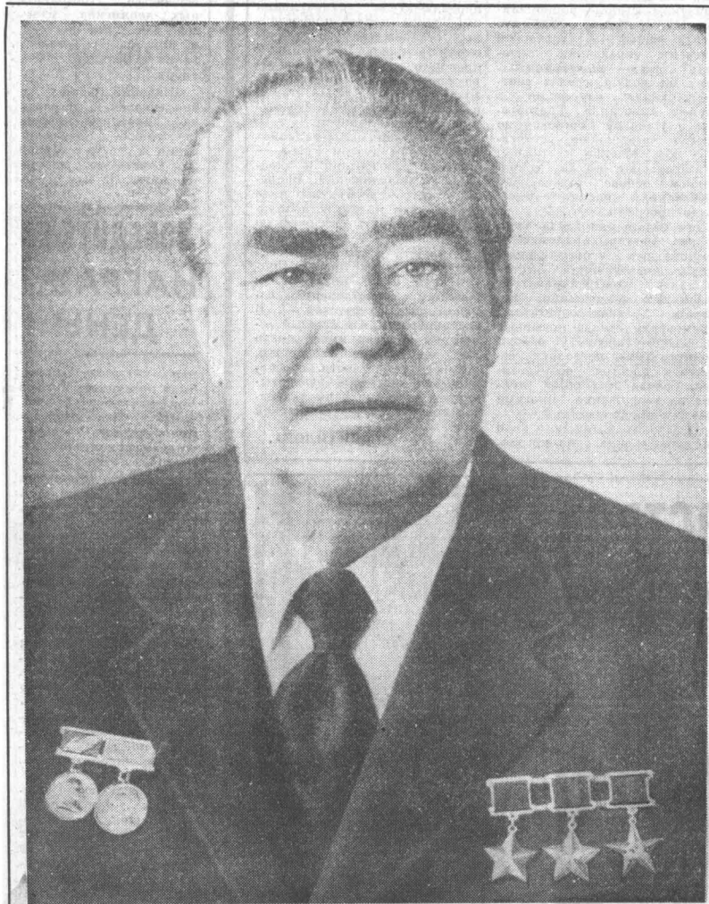
Генеральный секретарь ЦК КПСС, Председатель Президиума Верховного Совета СССР товарищ Леонид Ильич БРЕЖНЕВ.