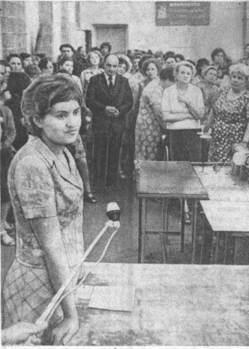
Митинг в швейном объединении «Авангард».