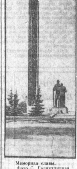
Мемориал славы.

Эта бригада делает заметный вклад в выполнение обязательств, взятых всем четвертым стройуправлением в честь 60-летия Великой Октябрьской социалистической революции.