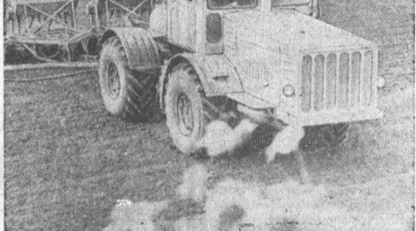
Фото-репортаж для Высокого Урожая

В Калманском районе заканчивается посевная страда юбилейного года. Завершили сев зерновых совхозы «Ягодный», «Юбилейный», «Кубанка», близки к этому остальные хозяйства.