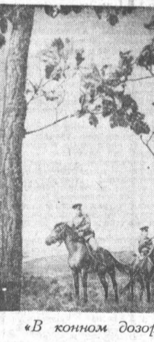
«В конном дозоре».