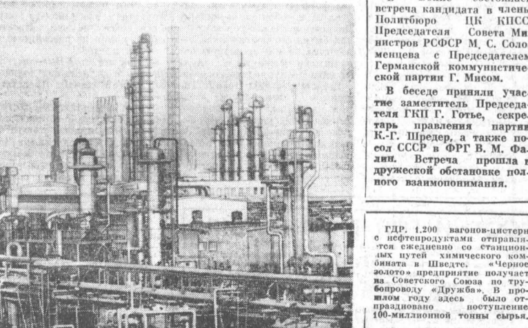
ГРП. 1.200 вагонов-цистерн с нефтепродуктами отправляется ежедневно со станционных путей химического комбината в Шведе. «Черное золото» предприятия поступает на Советского Союза по трубопроводу «Дружба». В прошлом году здесь было отгружено около полутора миллионов тонн сырья.