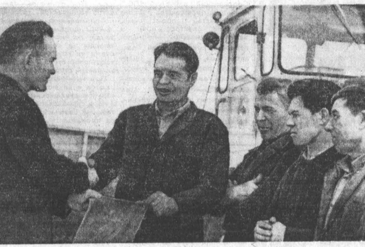
Станция Алейская сегодня — это крупный узел в составе Алтайского отделения Западно-Сибирской железной дороги, станция первой категории. Каждые сутки она провозит на север и на юг множество поездов, подают городским предприятиям десятки вагонов. Здесь множество различных технических подразделений. А рядом вырос жилой микрорайон с магазином, столовой, отличным детским садом на 200 мест, средней школой, Домом культуры, амбулаторией и больницей. Есть своя коммунальная и бытовая службы.

РАЗВИТИЕ ГОРОДА ОКАЗАЛОСЬ вновь в неразрывной связи с Турксибом.