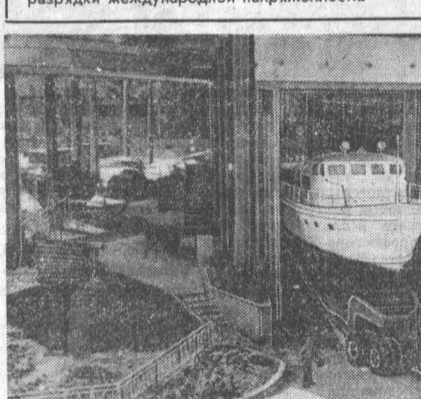
В Гаване при музее революции открыт мемориал яхты «Грамма» в связи с 20-й годовщиной высадки на юго-восточном побережье Кубы с небольшой моторной яхты «Грамма» отряда патриотов-революционеров во главе с Фиделем Кастро, которая положила нача-