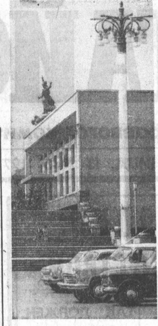
«У театрального подъезда».

В десятой пятилетке в Челябинском объединении будет организованно массовое серийное производство трактора Т-130 с двигателем мощностью 160 лошадиных сил. Помощь в выпуске трактора этой марки оказывает и Алтайский научно-исследовательский институт технологии машиностроения.