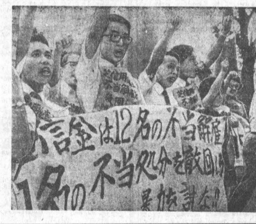
НА СНИМКЕ: рабочие протестуют против незаконных увольнений активистов профсоюза.

Прекратить дискриминацию коммунистов и других лиц прогрессивных убеждений — одно из требований трудящихся Японии в борьбе за права человека. Коммунисты — постоянный объект притеснений со стороны предпринимателей. Увольнения, оскорбления, слежка, дискриминация в оплате, отказ в приеме на работу — вот далеко не полный арсенал мер, при помощи которых предприниматели пытаются «изолировать» коммунистов и других лиц прогрессивных убеждений от остальных трудящихся.