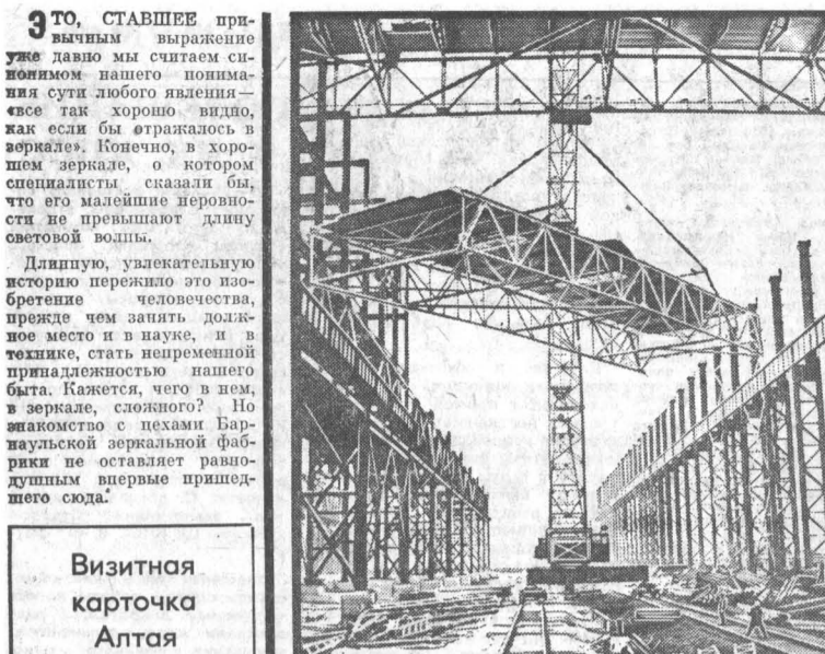
Визитная карточка Алтая КАК В ЗЕРКАЛЕ...