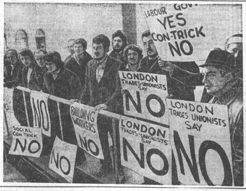
На снимке: пикет строительных рабочих Лондона, протестующих против возобновления «социального контракта».

По предварительным данным, около 70 процентов голосовавших сказали «нет» предложениям правых партий. Швейцарская партия труда и профсоюзы в совместном заявлении назвали идею раското- лать рабочий класс, свалить вину за экономический кризис и безработицу в Швейцарии на бесправных иностранных рабочих.