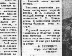
Трудовой коллектив Бийского металлургического завода.

В Томском районе открылся «Мастер» — школа для подготовки мастеров машинного дела Алтайского военного завода № 39 У. И. Мельников. До конца года персонал колхоза вывел новое обязательство.