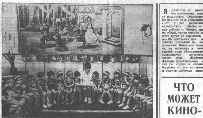
Урок сказки в одном из детских учреждений, которыми располагают будапештские транспортники.

ПРАГА. Началась электрификация железнодорожной магистрали Прага — Девоньш. Перевод на электрическую тягу этой важной линии начнется через два с половиной года. Как известно, первое Стокгольмское соглашение о запрете ядерного оружия в 1946 году подписали около 90 миллионов человек. Это была одна из крупнейших акций борьбы за мир, которую undertakely продемонстрировала, что общественно мнение является мощным фактором в международной политике, что волеизъявление народа имеет решающую роль в судьбе страны. В Чехословакии также проводится кампания по сбору подписей под соглашением о запрете ядерного оружия. В настоящее время в Чехословакии проводится кампания по сбору подписей под соглашением о запрете ядерного оружия.