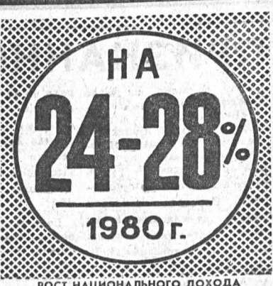
РОСТ НАЦИОНАЛЬНОГО ДОХОДА