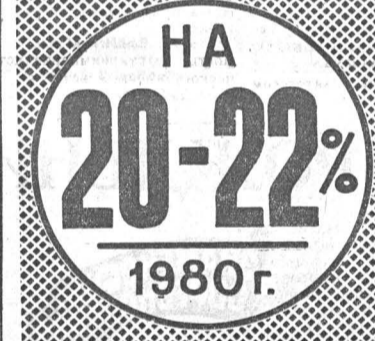
НА 20-22% 1980 г.

Часто приходит к голове: всем, чего достиг в жизни, я обязан земле. Земля не только дает высокие урожаи, она растит людей.