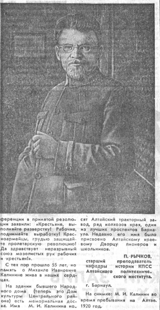
На снимке: М. И. Калинин во время пребывания на Алтае. 1920 год.

Газета «Красный Алтай» 25 ноября 1929 года вышла с крупным аншлагом на первой полосе: «Сегодня приезжает в Барнаул председатель ВЦИК т. Калинин. В его лице рабочие и крестьяне Алтая приветствуют высший орган Советской власти, три года мудро руководивший судьбами нашей республики».