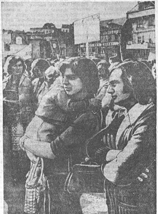
Экономический спад тяжелым бременем ложится на плечи французских трудящихся. Они предприятия закрываются, другие — сокращают производство. Согласно официальным данным, в конце сентября во Франции насчитывалось 1,460 тыс. сч безработных, сотни тысяч трудящихся переведены на неполную рабочую неделю. Тяжелое положение сложилось в Боллабене — небольшим городе на северо-западе страны. Расположенную здесь текстильную фабрику — одно из предприятий крупного концерна Буссан — решили закрыть, как не приносящую достаточных прибылей. 937 занятых на фабрике работников грозит увольнение. Рабочие отвечают на это решение предпринимателей демонстрациями протеста, участники которых требуют сохранения их рабочих мест. На снимке — во время одной из демонстраций рабочих текстильной фабрики в Боллабене.

Генерал Пиночет называет болезненное явление в экономике страны «социальными издержками». Но сами чилийцы определяют их как «социальное бедствие». Даже один из членов хунты генерал Ли вынужден был недавно признать, что упоминаемые издержки «перешагнули высоты». Выражая мнение умеренного крыла национальной буржуазии, крупный чилийский промышленник, бывший председатель СОФФА Орландо Занис замечает: «После 11 сентября 1973 года началась трагедия, которая постоянно углубляется». И. БОРОВИКОВ. АПН.