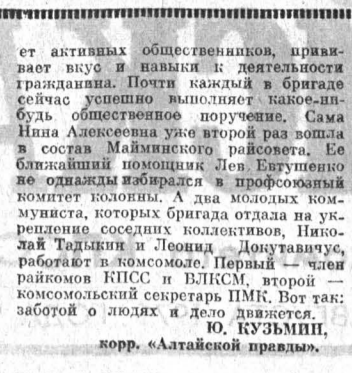
Беседу записал А. КАЛИНИЧЕНКО.