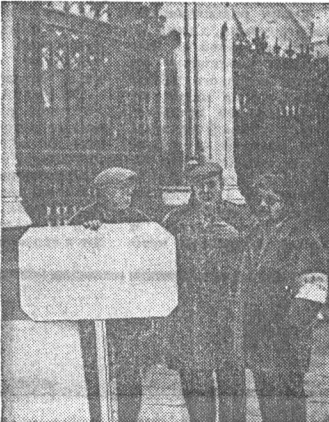
Все новые отряды английских трудящихся атакуют в борьбе за свои права. Недавно в Лондоне забастовали рабочие обслуживающего персонала и технических служб Вестминстерского дворца и правительственных зданий на Уайтхолле. Они требуют увеличения заработной платы. НА СНИМКЕ: пикет бастующих у здания парламента. Фото И. Макарина. Фотохроника ТАСС.

Участники совещания рассмотрели вопросы развития арабского национально-освободительного движения и положение в мировом коммунистическом и рабочем движении.