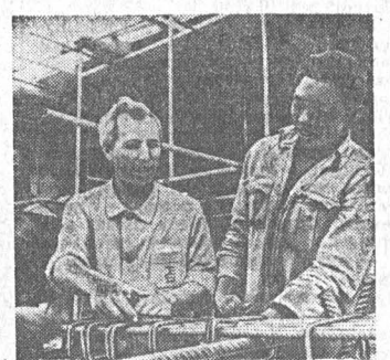
В Федеративной Республике Нигерии на острове Виктория болгарское объединение Техаспортстрой начало строительство 14-этажного здания отеля «Юкс», которое положило начало созданию на берегу живописной лагуны Гвинейского залива курортного комплекса. На территории отеля будут расположены плазменный бассейн, спортивные площадки. Болгарские и нигерийские строители обменялись опытом строительства за 22 месяца.