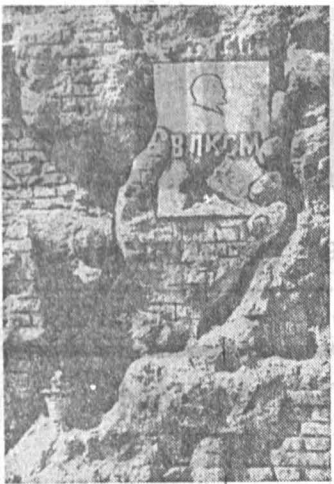
1942-й год. Сталинград.

Выписка из протокола комсомольского собрания. «Вопрос: Существуют ли уважительные причины ухода с огневых позиций? Ответ: Из всех оправдательных причин только одна будет принята во внимание — смерть!» Да, они, мальчишки и девчонки грозных соржовых повинуясь зову сердца и комсомольской совести, шли в бой и умирали ради жизни на земле, ради счастья грядущих поколений. Подтверждением тому — комсомольские билеты, обгоревшие кровью, пробитые осколками и пулями. Как символ коммунистической убежденности, готовности до конца бороться за высокие идеалы, храним мы и комсомольские билеты первых создателей колхозов, строителей Днепротреста, Магнитки, Комсомольска-на-Амуре, покори-телей целины, первооткрывателей и первопроходцев.