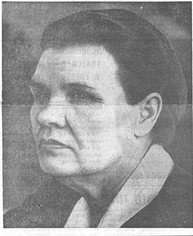
Главный показатель — качество работы

Ю. КОСОВ, корр. «Алтайской правды», Бийский район.