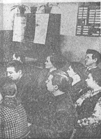
Павловский район.