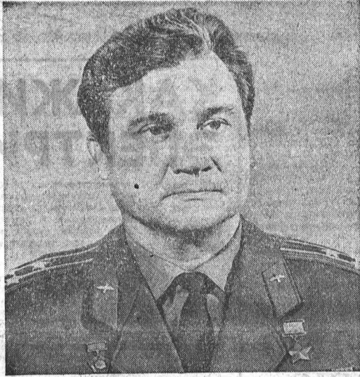
Командир корабля «Союз-16» Герой Советского Союза, летчик-космонавт СССР полковник А. В. Филиппенко.