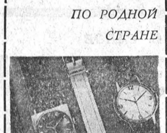
ПО РОДНОЙ СТРАНЕ