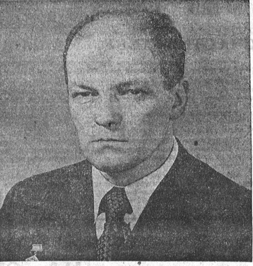
Бортинженер корабля «Союз-16» Герой Советского Союза, летчик-космонавт СССР Н. Н. Рукавишников.