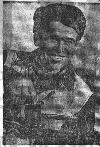
Железнодорожные строители станции Алтайская увеличили в последние месяцы сортировочный парк еще на две колеи. А в парке «В» монтажники закончили реконструкцию средств связи.

А. МАЛЫШЕВ, корр. «Алтайской правды», г. Бийск.