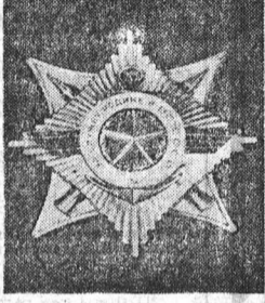
Орден «За службу Родине в Вооруженных Силах СССР» III степени