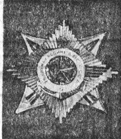
Орден «За службу Родине в Вооруженных Силах СССР» II степени