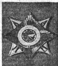
Орден «За службу Родине в Вооруженных Силах СССР» I степени

дена между противоположными гладкими концами звезды 65 мм, а между лучистыми — 58 мм. На оборотной стороне ордена имеет нарезной штифт с гайкой для прикрепления ордена к одежде. Лента к ордену «За службу Родине в Вооруженных Силах СССР» шелковая муаровая годового цвета шириной 24 мм с желтыми продольными полосками посередине: для I степени — одна шириной 6 мм, для II степени — две шириной по 3 мм каждая, для III степени — три шириной по 2 мм каждая. Секретарь Президиума Верховного Совета СССР М. ГЕОРГАДЗЕ.