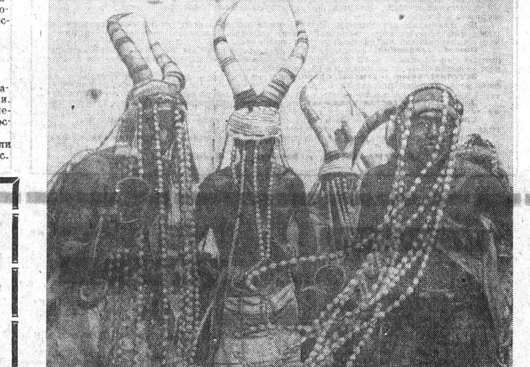
На снимке: воинственный танец народа басари, живущего на севере Того, характерен быстрым ритмом и большой пластичностью движений.

РИМ. Массовая демонстрация инвалидов труда состоялась во Флоренции. В ней приняли участие десять тысяч человек из разных городов области Тоскана.