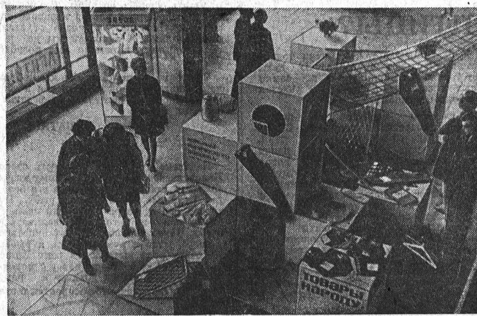
Экспозиция Барнаульского комбината химического волокна.

посетителей интересуют в первую очередь наши заводы-гиганты, от которых все мы, учитывая их и кадры, и технические возможности, вправе ожидать многого. Вот почему люди с особым пристрастием подолгу задерживаются у экспонатов трактор-