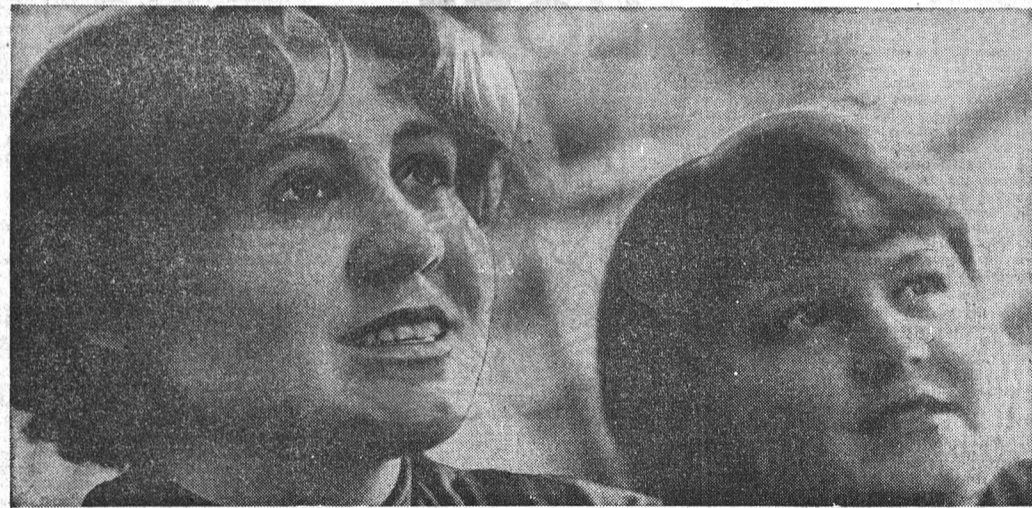
Второй год в рабочем посёлке Кулунды действует учебно-курсовой комбинат. За это время более тысячи механизаторов и животноводов прошли здесь переподготовку.

Сейчас в учебных классах комбината занимается более ста человек. Среди них группа женщин — будущих механизаторов. Уже весной нынешнего года они примут участие в полевых работах.