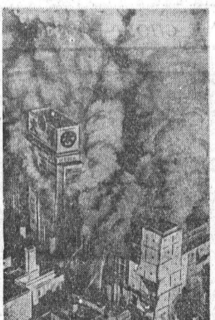
Почти 1.700 человек погибли в Японии в результате пожара в прошлом году. По данным «Белой книги о пожарах», опубликованной недавно управлением пожарной охраны, каждые девять минут в стране возникает пожар. Ежедневно гибнут и получают увечья десятки людей. Основная причина возникновения пожаров — случайность деревянных строений, составляющих 70 процентов всех городских зданий, недостаток противопожарного оборудования и несоблюдение правил противопожарной безопасности.

ВЕНА. (ТАСС). Газета «Фольксштимме» опубликовала статью, в которой подчеркивается, что радиостанция «Свобода» — это один из наиболее гнусных подстрекательских центров капиталистического мира. Этот центр управляется и финансируется американским ЦРУ, а его штаб-квартира расположена в Нью-Йорке. Основанный в разгар второй мировой войны в марте 1951 года, центр и по сей день остается побочником этой обанкротившейся политики, специализируется на подрывной пропаганде против Советского Союза. Из появившихся в распоряжение редакции газеты секретных документов этого подрывного центра — руководства по вопросам политики радиостанции «Свобода», а также директивы и косвенных указаний — следует, что конечной целью деятельности радиостанции является свержение политического строя в Советском Союзе или, как сказано в этих документах, «изменение существующей системы в Советском Союзе и других социалистических странах».