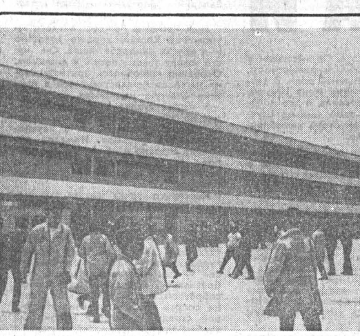
Латинская Америка. Многие изменились в обилие перуанской столицы Лимы за последние годы. Постепенно исчезают старые дома, гармоничные по стилю строения, соборы и храмы.

23 августа в Лондоне состоялось переговоры между лидерами британского конгресса трейдеров (БКТ) и правительством. На этой встрече, продолжавшейся весь день, рассматривались вопросы экономической политики консерваторов.