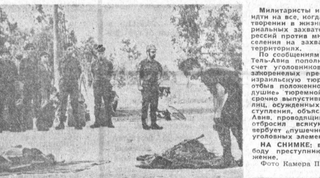
Милитаристы из Тель-Авива готовы идти на все, когда речь идет о претворении в жизнь политический территориальных захватов и массовых репрессий против мирного арабского населения на захваченных Израилем территориях.

По сообщениям зарубежной печати, Тель-Авив пополняет свою армию за счет уголовников. Недавно двадцать арестованных преступников поместили в израильский тюрьму Тель-Мона, не отбыв положенного срока. «Великодушные» тюремной администрации, до сироме выслушав их на свободу отпустили, осужденных за тяжкие преступления, объясняется просто: Тель-Авив, проводящий агрессивный курс, отбросил всякую человечность и вербует «пушечное мясо» даже среди уголовных элементов. НА СНИМКЕ, выпущенные на свободу преступники получают снаряжение.