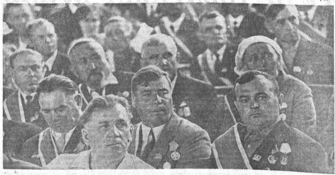
В зале торжественного собрания представителей трудящихся Алтая.