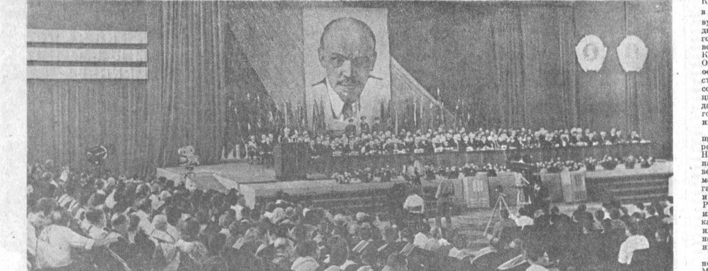
Идет торжественное собрание.