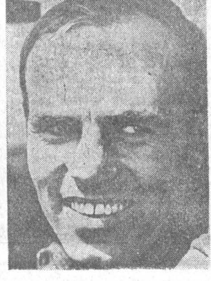
Ю. ЦЕДЕНБАЛУ ВРУЧЕНИЕ ОРДЕНА ОКТЯБРЬСКОЙ РЕВОЛЮЦИИ

Два дня на автодроме ДОСААФ в Барнауле проходил первый краевой конкурс профессионального мастера водителей. На первом этапе были проведены соревнования на предпрятиях, а затем в городах края. На краевой конкурс приехали тридцать три лучших водителя предприятий Алтайского транспортного управления. Шоферы мерились силами в фигурном вождении автомобиля, в вождении на экономном бензине, в эстафетах правых водителей движения и материальной части машины. П вот известны результаты: команд-