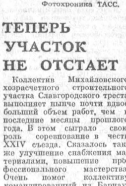
ТЕПЕРЬ УЧАСТОК НЕ ОТСТАЕТ