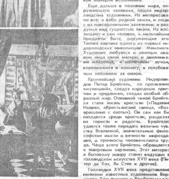
НА СНИМКАХ (сверху вниз): ЛЕНЕН. «Возвращение с сенокоса». ПИТЕР БРЕЙГЕЛЬ-старший. «Охотники на снегу». ЭМГР. «Портрет». ВЕРМЕЕР ДЕЛЬФТСКИЙ. «Мастерская живописца».

риод творчества Боттичелли ознаменовался созданием таких известных работ, как «Весна» и «Рождение Венеры». С этих полотен смотрит на нас через века особенно хрупкий и поэтический мир юности и красоты. Музыка плавных линий, легкие, точно парящие в воздухе движения, нежное сияние лазурных и золотистых красок покоряют зрителя.