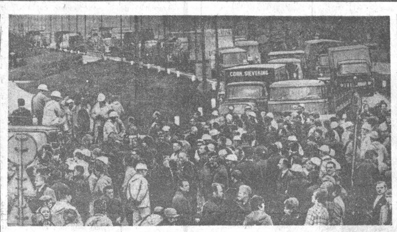
Недавно на заводах, фабриках и в учреждениях Голландии на час остановились работники по призыву профсоюзных трудящихся страны провели забастовку и митинг протеста против правительства его решения о «замораживании» заработной платы. НА СНИМКЕ: бастующие работники на заводе, ведущей в Амстердаме.

ПХЕНЬЯН, 8 января. (ТАСС). Здесь опубликовано сообщение агентства ЦТАК, в котором говорится, что американские империалисты совершили новую провокацию против Корейской Народно-Демократической Республики. 6 января, говорится в сообщении агентства, США тайно эскалировали вооруженные шпионские суда в территориальные воды северной части Корейского полуострова Чансан. Будучи обнаруженными северокорейскими патрульными судами, суда стали уходить на юг, ведя беспорядочную стрельбу. Морские Корейской народной армии потопили один шпионский корабль. А другой повредили.