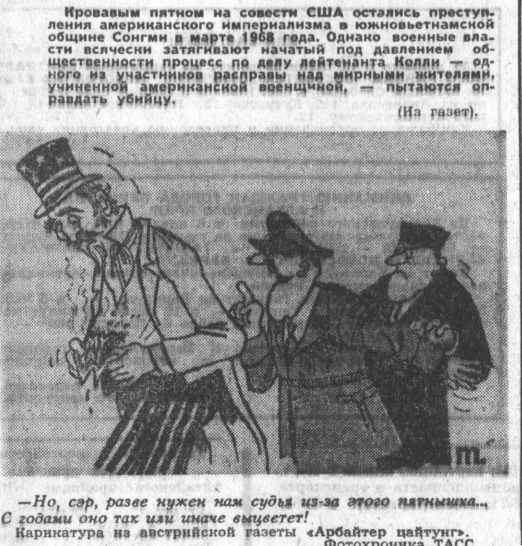
— Но, сэр, разве нужен нам судья из-за этого пятнышка... С годами оно так или иначе выцветет! Карикатура на австрийской газете «Арбайтер цайтунг».