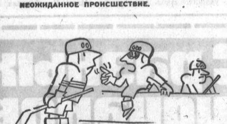
ВЕРНУСЬ — НИЧЕГО, ЧЕРЕЗ НЕСКОЛЬКО МИНУТ