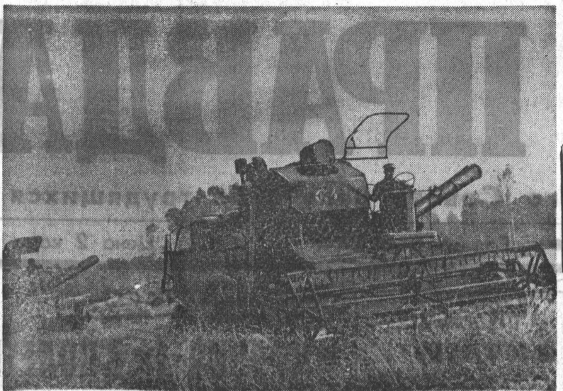
В КРАЕ ЗА ПЯТИЛЕТКУ ЗАГОТОВКИ ЗЕРНА ВОЗРОСЛИ ПО СРАВНЕНИЮ С ПРОШЛОМ НА 40,4 ПРОЦЕНТА.