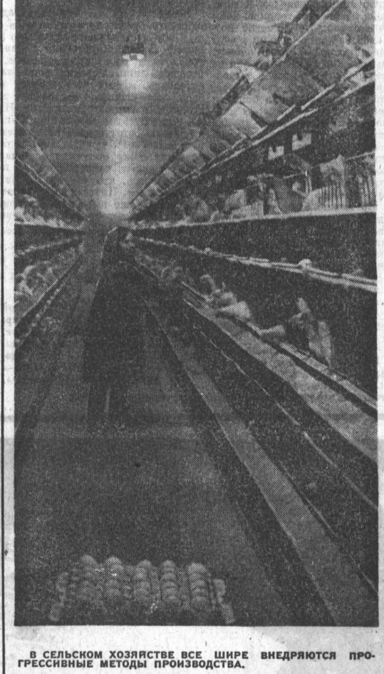
В СЕЛЬСКОМ ХОЗЯЙСТВЕ ВСЕ ШИРЕ ВНЕДРЯЮТСЯ ПРОГРЕССИВНЫЕ МЕТОДЫ ПРОИЗВОДСТВА.