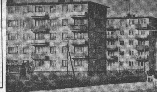
В ПОСЛЕДНИЕ ГОДЫ НА АЛТАЕ 68 ТЫСЯЧ СЕМЕЙ СПРАВИЛИ НОВОСЕЛЬЕ.