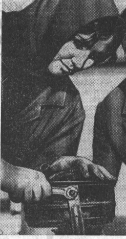
Путевки в «Артек»

РУССКИЙ БЫТОВОЙ РОМАНС Артисты литературы и музыканты лекторской группы филармонии подготовили новый концерт. Он называется «Русский бытовой романс». В программу включены произведения русских композиторов прошлого века. Романсы, впервые прозвучавшие со сцены многие десятилетия назад, до сих пор любимы народом. Новая программа уже была исполнена в районных библиотеках, в профессионально-технических училищах «Сибиряк» № 13 и 33. В ближайшее время артисты дадут свой новый концерт в Бийске, Барнауле и Рубцовске. П. ЛЮБИМОВ.