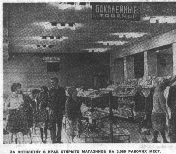
ЗА ПЯТИЛЕТКУ В КРАЕ ОТКРЫТО МАГАЗИНОВ НА 3.080 РАБОЧИХ МЕСТ.

ЖИЗНЬ: ОТЧЕТЫ И ВЫБОРЫ С партийной конференции Целинного района